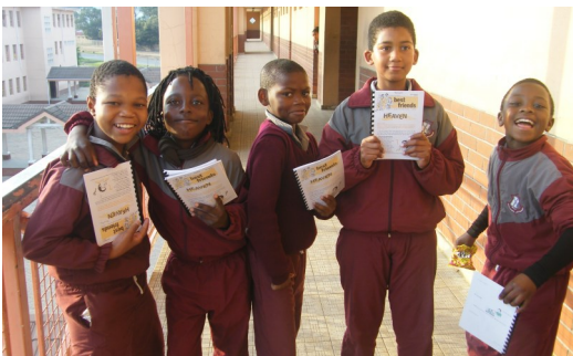
"BESTE VRIENDE" by Danie Ackermann

2. Verkleurmannelies: Die Evangelie word d.m.v. kleure aan die kleuters oorgedra! So stel bv. die goue kleur=God, swart-sonde en rooi=Jesus voor. Speel-speel en kleurvol leer kleuters die basiese waarhede van die evangelie. Uitstekend vir pre-primêr.