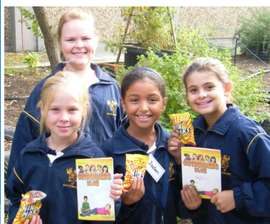
"ONTDEKKERS KLUB" by Beaumont-ons

te verseker dat daar interaktiewe deelname in die klas is. God se Woord is ons Swaard (Efesiërs 6:17) en in die program verkry die kinders 'n dieper kennis van die Bybel .