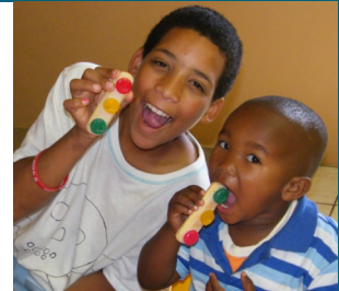
By Croydon: Robot bak-en-brou! God antwoord altyd as ons bid: ja/nee/wag!

De Hoop gr3 kies om in Jesus se lig te bly!